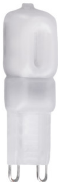
GIO LED G9