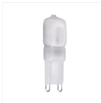
GIO LED G9