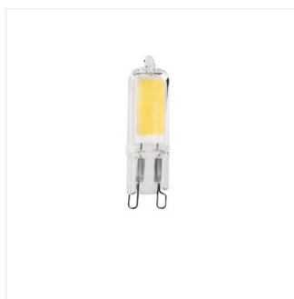
G9 GLASS LED2W