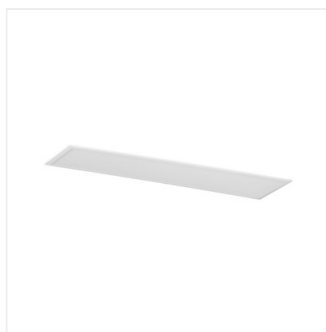
BRAVO S 40W12030NW W