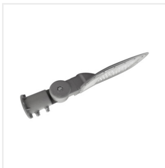
STRETON LED 40W WW