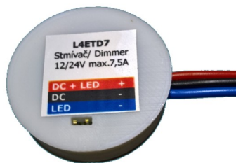
Provedení L4ETD7H s vývody do strany

Pro opětovnou změnu režimu tento postup opakujte. Režimy se přepínají cyklicky 1-2-3-1-2....atd., pro posun o 2 kroky je tedy potřeba celou proceduru provést 2x.