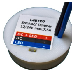
Provedení L4ETD7V s přímými vývody